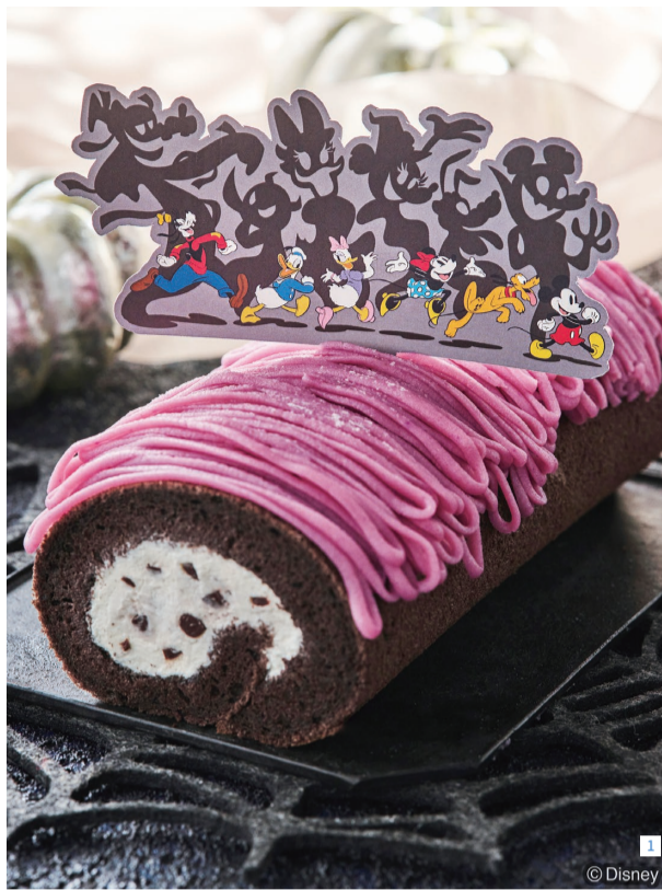
1 © Disney

毎日の食事作りに役立つレシピをはじめ、パンやケーキ作りを学べるレッスンを行っているABCクッキングスタジオ。9月と10月にはお得な体験レッスンを実施している。「初めてご来店する方は通常4,400円相当のレッスンを550円で体験できます」と店長の俵山奈々さん。お薦めはディズニーキャラクターをモチーフにしたロールケーキを作るレッスンだ。「家族で楽しむハロウィンパーティーにもぴったりな、かわいいロールケーキをお持ち帰りいただけます」。また、ソース作りから学べる煮込みハンバーグを作るレッスンも人気。パン作りを同時に体験できるのもポイントだ。「お得なこの機会にぜひご来店ください」