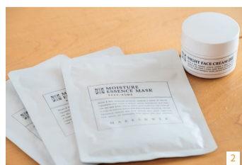
1. モイチャーエッセンスウォーター限定酒粕/コメ 110ml2,420円 2. モイチャーエッセンスマスク限定酒粕/コメ1枚入り440円、ナイトフェイスクリーム限定酒粕/コメ 45g3,000円 3. 植物の恵みを生かしたケアアイテムが充実している