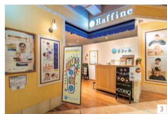
1. 温感ジェルを用いてリンパの流れを促す温感ヘッド&ネック20分コース 2,980円 2. 温感ヘッド&ネック+ボディケア60分コース 7,180円 3. 寒い季節にお薦めのケアメニューが充実している