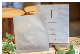
1. エッフェオーガニックのディープモイチャーローション、ディープモイチャーミルク各4,180円 2. エッフェオーガニックのディープモイチャーシートマスク1枚880、4枚入3,300円 3. 季節ごとのスキンケアアイテムがそろそろ