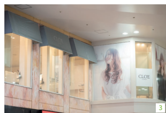
1. カット+質感再整カラー+4stepトリートメント9,900円〜 2. アルタイムリペアのヘアトリートメント、ヘアオイル、ナイトトリートメント各4,180円 3. トレンドを取り入れた理想のスタイルを叶えてくれると評判だ